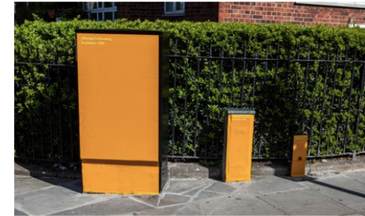
Dans une rue de Kensington, le nombre de logements "abordables" à Londres en 1995, 2005 et 2015. Roberta Schmidt/Streetgraphs