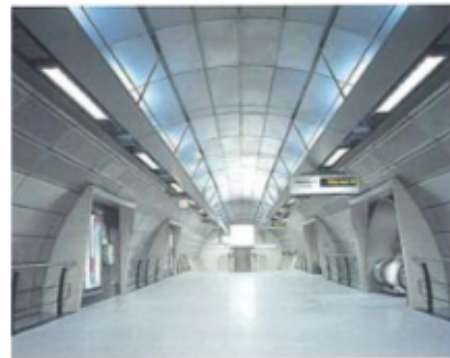
La station Southwark sur la Jubilee Line. MacCormac Jamieson Prichard architectes