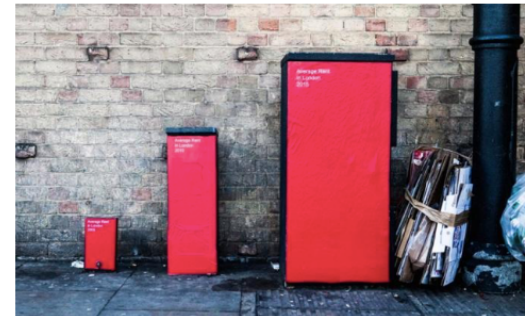
A Hackney, l'augmentation du loyer moyen à Londres entre 2005, 2010 et 2015. Roberta Schmidt/Streetgraphs

http://www.france.tv/info.fr/replay-magazine/france-2/l-angle-e-co/video-a-londres-une-autre-vision-des-inegalites_826869.html