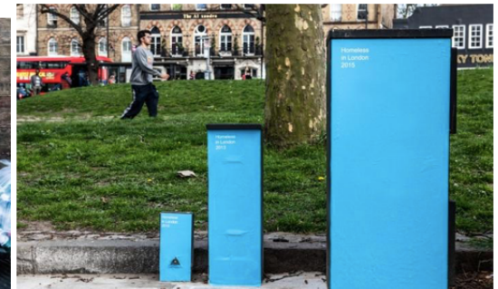
De gauche à droite, le nombre de SDF à Londres en 2010, 2013 et 2015. Roberta Schmidt/Streetgraphs

Quelles difficultés sociales liées au logement, communes aux docklands et à l'ensemble de Londres, sont dénoncées par ces documents? Quelles sont leurs conséquences ?